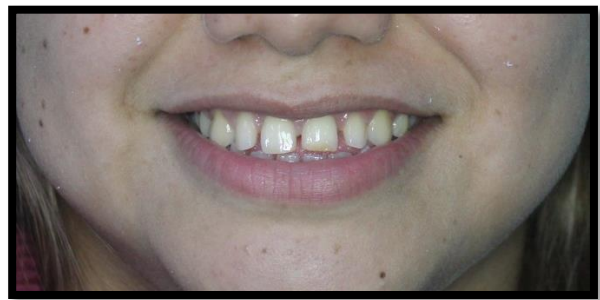
Ilustración 4 sonrisa inicial