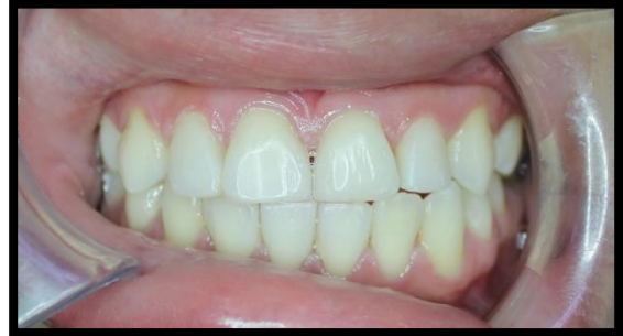
Ilustración 3 Resultado final

En la última fotografía vemos la sonrisa de la paciente muy satisfecha con su cambio (véase fotografía #5)