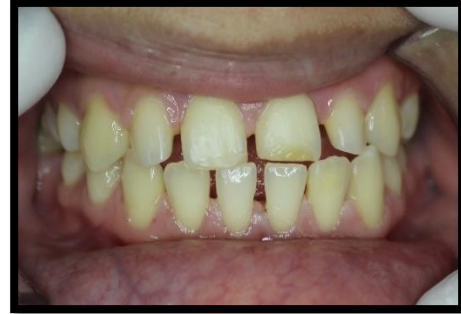
Ilustración 1 situación inicial de la paciente

En el caso de nuestra estimada paciente fue posible realizarlas sin desgaste ya que lo que no le gustaba de sus dientes era los espacios y formas, (véase ilustración 1)