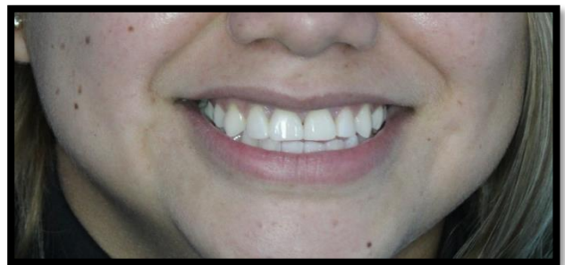
Ilustración 5 sonrisa final